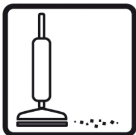
Puhasta ala kasutades selleks tolmuimejat.