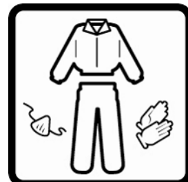
Kata nähaolev nahk. Töötades ventileerimata alal kannu ühekordset näomaski.