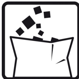
Prügi käitlemine peab toimuma vastavalt kohalikule regulatsioonile.