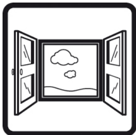
Õhuta võimalusel tööruumi.

Juhul, kui karedad kiud satuvad nahale, võib mehaanilise mõju tõttu tunda ajutist sügelust.